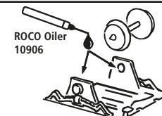
ROCO Oiler 10906

Les pièces de finition illustrées sont à monter par le modéliste. Le jeu de pièces peut comprendre d'autres pièces (non illustrées) qui sont destinées à autres versions du modèle et qui sont superflus à la variante présente.